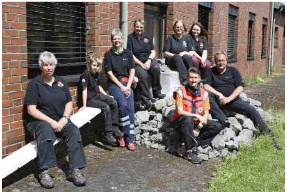
Einige Mitglieder der BRH-Staffel Südwestfalen.