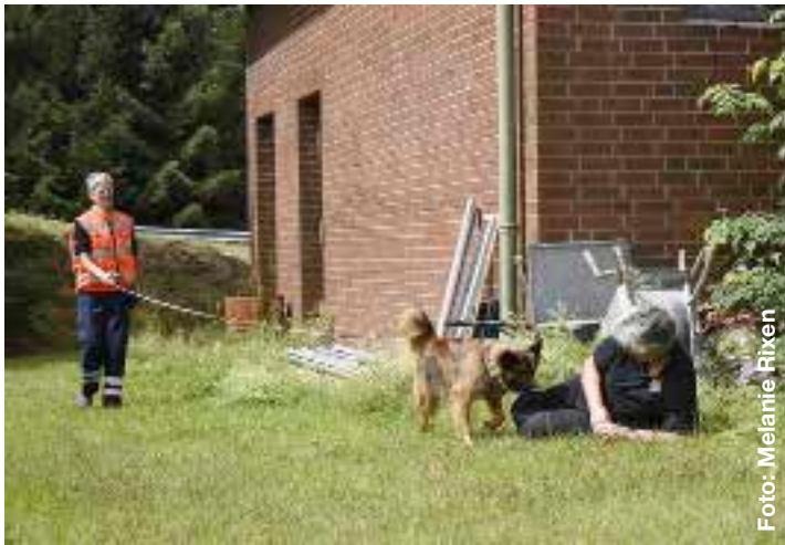
In der ehemaligen Kaserne sind sogar die ersten Ausbildungsschritte im Mantrailing möglich.

Der Trail weist mehrere Richtungswechsel auf und führt durch bebauten Gebiet und auch über Naturflächen. Der Hund müsste also schon unerschrocken Glück haben, um die Versteckperson ohne Nasenarbeit zu finden.