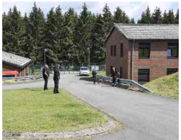
Die BRH-Staffel Südwestfalen hat ihren Standort in einer ehemaligen Kaserne. Diese bietet viele Möglichkeiten zur Ausbildung.