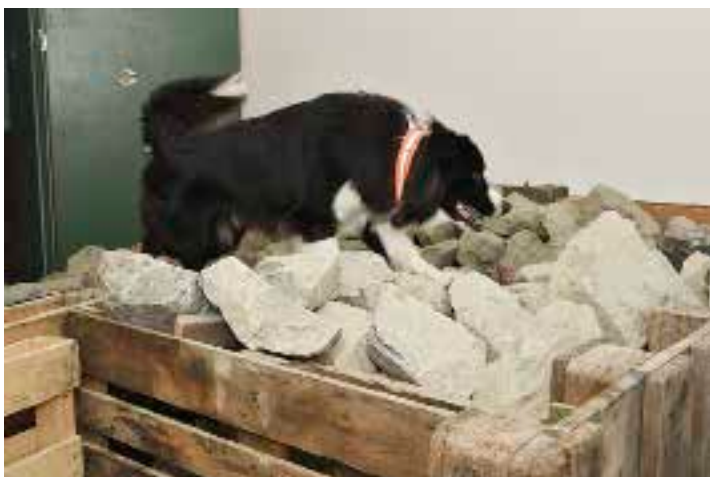
Viele ehemalige Stuben wurden in Trainingsräume verwandelt.